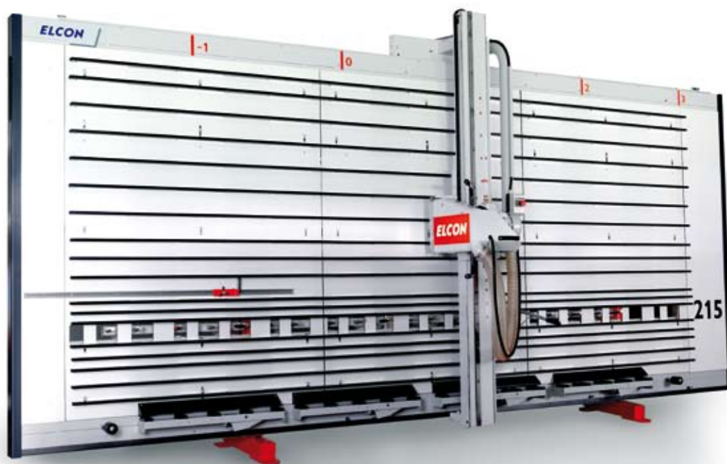
Führung des Sägewagens

Weitere Vorteile der D Baureihe sind die sehr geringe Aufstellfläche und die hohe Austrittstiefe des Sägeblattes von 25 mm hinter der Platte. Dies garantiert ein gutes Schnittbild und eine hohe Standzeit des Sägeblattes.